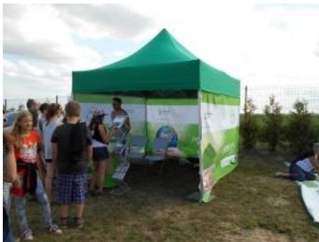
Fot.9 Zdjęcie wykonane podczas spotkania w Głędowie

W pięknie sobotnie popołudnie 18 lipca 2015r. gościliśmy na terenie gminy Człuchów, w miejscowości Głędowo. Odbywała się tam wakacyjna impreza pod nazwą „Dni Młodości”. Tym razem pogoda sprzyjała wysokiej frekwencji osób odwiedzających nasze stoisko. Mieszkańcy gminy chętnie nawiązywali konwersację a najmłodszy z wielką pasją uczestniczyli w grach edukacyjnych.