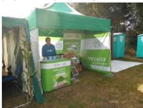
Fot. 2 Zdjęcie namiotu wraz z wyposażeniem

Namiot został wykonany tak, aby reklamować zarówno kampanię jak i dotującego, tzn. Wojewódzki Fundusz Ochrony Środowiska i Gospodarki Wodnej w Gdańsku. Dodatkowo zakupiono trybunkę z nadrukowaną informacją o dofinansowaniu, jak się później okazało niezwykle potrzebny stojak do ulotek oraz roll-up (również z informacją o dofinansowaniu), który był używany zarówno podczas wydarzeń gminnych, jak i spotkań w gminach i szkołach. Wszystkie te zakupy miały na celu promocję kampanii oraz informowanie odwiedzających o otrzymaniu dofinansowania na realizację projektu z Wojewódzkiego Funduszu Ochrony Środowiska i Gospodarki Wodnej w Gdańsku.