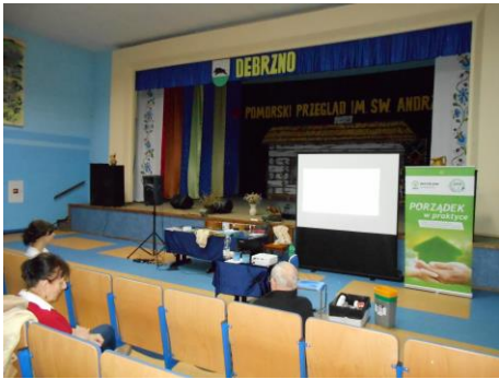
Fot.21 Zdjęcie wykonane podczas wydarzenia w Debrznie. Liczba osób na zdjęciu: 3

9 lutego 2016r. podczas spotkanie mieszkańców miejscowości Lichnowy zaprezentowano kampanię „Porządek w praktyce”.