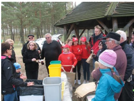
Fot. 33 Zdjęcie wykonane podczas wydarzenia w Koczale. Liczba osób na zdjęciu: 17

Do nietypowego spotkania doszło 23 kwietnia 2016 r. nad Jeziorem Dymno w Gminie Koczała. Mieszkańcy tej gminy co roku wspólnie porządkują brzeg jeziora. Dzięki zaproszeniu mogliśmy uczestnikom spotkania zaprezentować program naszej kampanii.