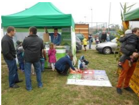
Fot.12 Zdjęcie wykonane podczas wydarzenia w Brusach