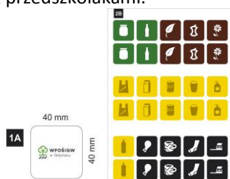
Rys. 6 Projekt gry memory (projekt w wersji elektronicznej załączony na płycie CD)

Pomysł, aby przygotować materiały edukacyjne również dla najmłodszych był bardzo trafną decyzją. Gra memory jest znaną i lubianą zabawą przez najmłodszych. Dobieranie par ćwiczy pamięć i spostrzegawczość. Wykorzystaliśmy ten typ gry, aby uczyć dzieci podstawowych kolorów segregacji. Przykładowo rysunek słoika umieściliśmy na zielonym polu, dzięki czemu w pamięci dziecka powstają skojarzenia słoika z zielonym kolorem. Osoba dorosła może podczas zabawy tłumaczyć dziecku, iż słoiki wyrzucamy do pojemnika zielonego na opakowania szklane, a natomiast kubek, którego symbol jest zamieszczony na czarnym tle, wyrzucamy do pojemnika czarnego na odpady zmieszane. Gry memory były rozdawane głównie podczas wydarzeń w gminach oraz podczas zajęć z przedszkolakami.