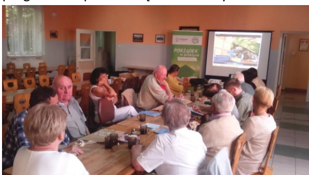
Fot.35 Zdjęcie wykonane podczas wydarzenia w Czersku. Liczba osób na zdjęciu: 14

29 czerwca 2016 r. odbyło się ostatnie ze spotkań kampanii „Porządek w praktyce”. Podczas walnego zebrania Stowarzyszenia Miłośników Ziemi Czerskiej w Remizie OSP w Czersku został przedstawiony program kampanii Porządek w Praktyce.