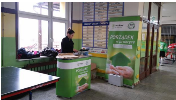
Fot.15 Zdjęcie wykonane podczas wydarzenia w Przechlewie

21 lutego 2016r. w hali sportowej przy Szkole w Przechlewie odbyły się rozgrywki JFA CUP pod patronatem Pomorskiego związku Piłki Nożnej rocznik 2005. Niestety, nie udało nam się odwiedzić Gminy Przechlewo w okresie letnim, wykorzystaliśmy więc bardzo popularny w miejscowości turniej piłkarski, aby w ten sposób rozpowszechnić program kampanii „Porządek w Praktyce”.