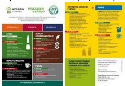
Rys.2 Projekt ulotki (projekt w wersji elektronicznej załączony na płycie CD)

Projekt ulotki były jednym z pierwszych poważniejszych wyzwań tej kampanii. Trudność w ich projekcie polegała na stworzeniu uniwersalnej treści dla mieszkańców 12 gmin, uwzględniając różnice w gospodarce pojemnikowej każdej z gmin. Dzięki współpracy z przedstawicielami gmin udało nam się wyprodukować ulotkę informacyjną uniwersalną dla całego regionu, która jednocześnie była wystarczająco szczegółowa. Dzięki wybraniu odpowiedniego formatu ulotki oraz grubości papieru ulotki spotkały się z bardzo życzliwym przyjęciem przez mieszkańców. Ulotki towarzyszyły kampanii przez cały okres jej trwania. Zostały one przekazane do gmin, były rozdawane podczas wydarzeń gminnych, spotkań w gminach i szkołach oraz przekazywane na prośbę np. wspólnot mieszkaniowych, nauczycieli itp.