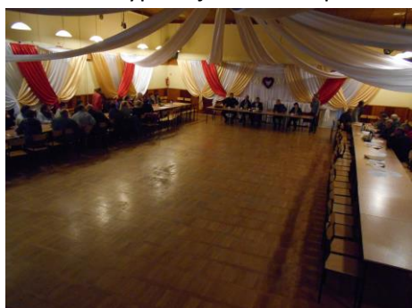
Fot.19 Zdjęcie wykonane podczas spotkania w Konarzynie. Liczba osób na zdjęciu: 33

Spotkanie w Gminie Konarzyny odbyło się 21 października 2015r. w Gminnym Ośrodku Kultury w dość nietypowej scenerii. Spotkanie edukacyjne odbyło się na rozpoczęcie spotkania wiejskiego.