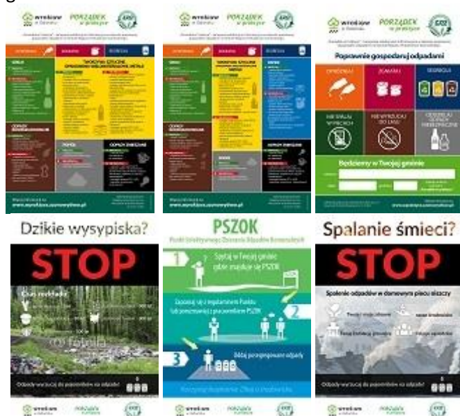
Rys. 3 Projekty plakatów (projekty w wersji elektronicznej załączone na płycie CD)

3 projekty plakatów wykonane zostały w formacie A3. Mniejszy format wydrukowanych plakatów wynikał z prośby ze strony gmin, argumentowanej ograniczoną powierzchnią gminnych gablot. Projekty plakatów dotyczyły następujących tematów: spalania odpadów w piecach, nielegalnych wysypisk oraz Punktu Selektywnego Zbierania Odpadów Komunalnych. Plakaty zostały przekazane gminom.