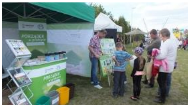
Fot.4 Zdjęcie wykonane podczas wydarzenia w Konarzynach

31 maja 2015r. program kampanii był prezentowany na boisku gminnym w Konarzynach, gdzie zorganizowano imprezę z okazji Dnia Dziecka. Wydarzenie przyciągnęło bardzo dużo mieszkańców gminy Konarzyny i turystów. Nasze stoisko odwiedzały całe rodziny. Dzieci chętnie bawiły się w edukacyjne gry, natomiast dorośli byli bardzo zainteresowani materiałami informacyjnymi.