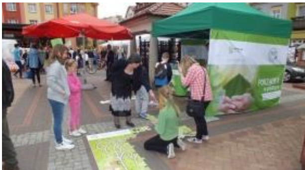
Fot.5 Zdjęcie wykonane podczas wydarzenia w Chojnicach

1 czerwca 2015r na płycie Starego Rynku w Chojnicach odbył się Wielki Dzień Dziecka. Wśród wielu propozycji dla dzieci znalazła się również nasza – namiot kampanii edukacyjno-informacyjnej „Porządek w praktyce”. Szczególnym zainteresowaniem cieszyły się nasze mega puzzle. Zarówno mniejsze jak i starsze dzieci chciały spróbować swoich sił w zabawie. Każdy maluch otrzymał od nas upominek i ulotki dla rodziców.