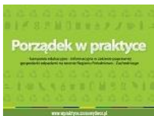
Rys. 5 Element okładki broszury (projekt w wersji elektronicznej załączony na płycie CD)