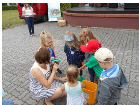
Fot. 17 Zdjęcia wykonane podczas Jarmarku Ekoturystycznego w Charzykowach

Do sprawozdania załączona jest następująca dokumentacja Jarmarku Ekoturystycznego