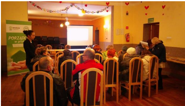
Fot. 26 Zdjęcie wykonane podczas wydarzenia w Olszanowie. Liczba osób na zdjęciu: 14