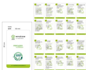
Rys. 7 Projekt gry (projekt w wersji elektronicznej załączony na płycie CD)

Gra Quiz została stworzona z myślą o starszych dzieciach. Dzięki przygotowaniu zestawu pytań o treści ściśle związanej z gospodarką odpadami powstała nietypowa propozycja edukacyjna, która zyskała uznanie szczególnie wśród nauczycieli. Gra quiz jest zabawą, w którą może grać kilka osób. Każdy z graczy otrzymuje taką samą ilość kart. Rozpoczyna osoba najmłodsza zadając pytanie osobie po prawej stronie. Gracze zadają pytania sobie wzajemnie, z tym że osoba zadająca pytanie zna odpowiedź (jest ona zaznaczona pogrubioną czcionką). Jeśli odpowiedź będzie poprawna przekazuje kartę osobie, która zgadła odpowiedź. Karta z pytaniem, na które została udzielona błędna odpowiedź zostaje w puli pytań. Wygrywa osoba, która zdobędzie najwięcej kart. Gra ta może być wykorzystana podczas zajęć w szkole, świetlicy bądź w domu. Karty mogą być również używane wg własnych zasad. Najważniejsze dla nas było, aby treści edukacyjne zostały przekazane młodzieży.