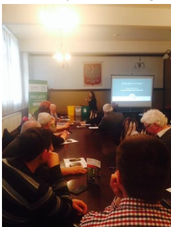
Fot. 32 Zdjęcie wykonane podczas wydarzenia w Urzędzie Gminy Człuchów Liczba osób na zdjęciu: 10

30 marca 2016r. w Urzędzie Gminy w Człuchowie odbyło się spotkanie dla radnych i sołtysów Gminy Człuchów, podczas którego zaprezentowano program kampanii „Porządek w praktyce”