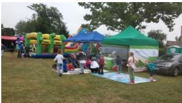
Fot.7 Zdjęcie wykonane podczas wydarzenia w Sokole

odwiedzającym, że rozgrywano gry do 3 zwycięstw. Dorośli mieszkańcy z uwagą przeglądali ulotki i dopytywali o szczegóły segregacji odpadów.