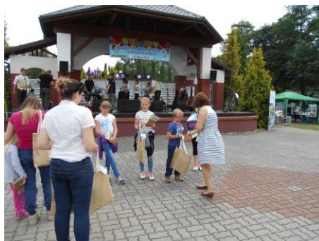
Fot. 16 Zdjęcia wykonane podczas Jarmarku Ekoturystycznego w Charzykowach