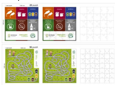
Rys. 12 Projekty puzzli (projekty w wersji elektronicznej załączone na płycie CD)

Mega puzzle zostały przygotowane w dwóch wariantach: prostszej dla młodszych dzieci, oraz w wersji bardziej wymagającej przygotowanej z myślą o starszych dzieciach. Puzzle kusiły dzieci i stawały się dla nich często nie lada wyzwaniem. Dzięki tej zabawie nasz namiot odwiedziło wiele rodzin, które otrzymały od nas materiały informacyjne. Po ułożeniu puzzli prosiliśmy dzieci o przeczytanie haseł. Proste przesłanie pozwoliło na przekazanie najbardziej istotnych treści kampanii.