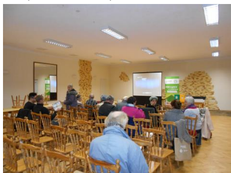
Fot.20 Zdjęcie wykonane podczas wydarzenia w Debrznie. Liczba osób na zdjęciu: 13

Spotkania w Gminie Debrzno odbyły się 3 i 17 listopada 2015r. Były to spotkania specjalnie dedykowane kampanii.