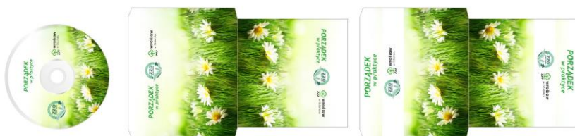
Rys. 10 Projekt okładki (projekt w wersji elektronicznej załączony na płycie CD)

Płyty CD zostały przygotowane na zakończenie kampanii. Na płycie zamieszczono animację edukacyjną zawierającą najważniejsze elementy informacyjne kampanii oraz dwa wyróżnione w konkursie „Segregujemy” filmy. Zamieszczenie filmów było wyróżnieniem i formą nagrody dla laureatów konkursu. Płyty były rozdawane w szkołach, na spotkaniach gminnych i podczas imprez.