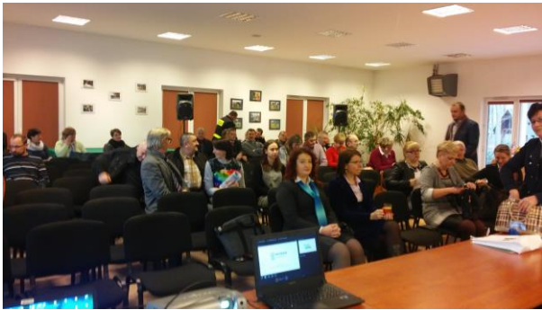
Fot.23 Zdjęcie wykonane podczas wydarzenia w Bińczu . Liczba osób na zdjęciu: 30

12 lutego 2016r. spotkanie dla rolników Gminy Czarne odbyło się od prelekcji dotyczącej segregacji odpadów.