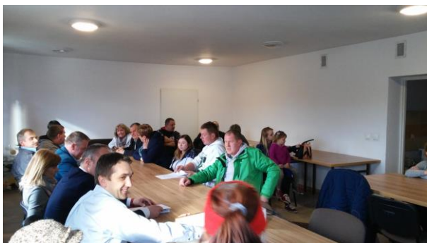
Fot.29 Zdjęcie wykonane podczas wydarzenia w Breńsku. Liczba osób na zdjęciu: 19