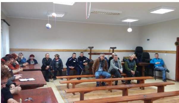
Fot.27 Zdjęcie wykonane podczas wydarzenia w Pieniężnicy. Liczba osób na zdjęciu: 18