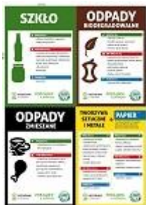
Rys 4. Projekt naklejki (projekt w wersji elektronicznej załączony na płycie CD)

Naklejki na śmietniki okazały się bardzo dobrym pomysłem. Mieszkańcy bardzo chwalili sobie tę formę informacji. Na naklejkach, z racji ograniczonej powierzchni, nie było można zamieścić zbyt wiele treści. Zdecydowano więc, aby umieścić informacje najbardziej istotne. Naklejkę żółtą podzielono dodatkowo na dwie kolumny. Z jednej strony opisano zalecenia dotyczące odpadów z tworzyw sztucznych, metalu i opakowań wielomateriałowych, zaś z drugiej strony, te dotyczące odpadów z papieru. Był to celowy zabieg, który pozwolił na zachowanie uniwersalności naklejek dla wszystkich gmin. Wystarczy aby mieszkańcy gmin, w których obowiązuje pojemnik niebieski przecięli naklejkę wzdłuż kolumn. W ten prosty sposób mogli nakleić informację na każdym z używanych pojemników na odpady.