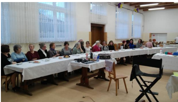
Fot. 24 Zdjęcie wykonane podczas wydarzenia w Brusach. Liczba osób na zdjęciu: 22

5 marca 2016r. z okazji Dnia Kobiet zorganizowano spotkanie z myślą o Paniach. To wyjątkowe spotkanie rozpoczęło się od prezentacji kampanii „Porządek w praktyce”