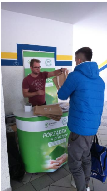
Fot.14 Zdjęcie wykonane podczas wydarzenia w Debrznie