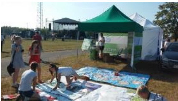
Fot.6 Zdjęcie wykonane podczas wydarzenia w Człuchowie

13 czerwca 2015r na Stadionie w Człuchowie odbyły się Dni Człuchowa. Zakład Zagospodarowania Odpadów Nowy Dwór Sp. z o.o., dzięki gościnności Gminy Miejskiej w Człuchowie oraz organizatorów imprezy, mógł zaprezentować mieszkańcom Człuchowa najważniejsze założenia kampanii „Porządek w praktyce”. Wspaniała pogoda sprzyjała dużej frekwencji osób uczestniczących w wydarzeniu. Nasza oferta szczególnie spodobała się dzieciom, które z wielkim zaangażowaniem uczestniczyły w zabawach edukacyjnych. Nasze stoisko wzbudziło duże zainteresowanie, również wśród dorosłych. Osoby odwiedzające nasz namiot pytały o szczegóły dotyczące segregacji, o zagadnienia związane z recyklingiem.