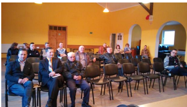
Fot.30 Zdjęcie wykonane podczas wydarzenia w Międzyborzu. Liczba osób na zdjęciu:15