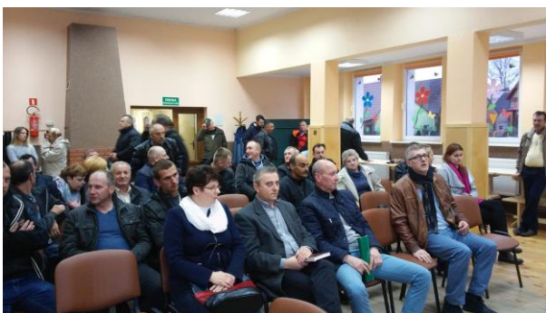
Fot.28 Zdjęcie wykonane podczas wydarzenia w Brzeziu. Liczba osób na zdjęciu:32