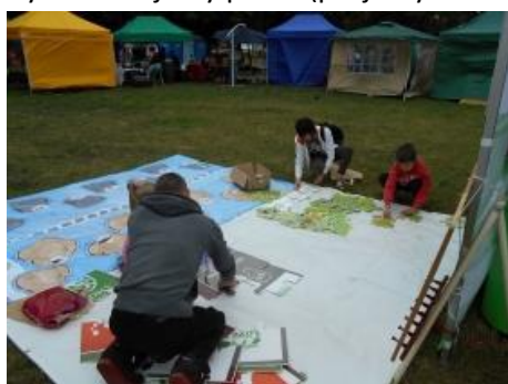
Fot. 3 Zdjęcie przygotowanych zabaw dla najmłodszych