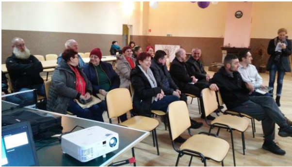
Fot. 25 Zdjęcie wykonane podczas wydarzenia w Gwieździnie. Liczba osób na zdjęciu: 16

10 marca 2015r. rozpoczął się cykl spotkań dla mieszkańców Gminy Rzeczenica. Podczas każdego z sołeckich spotkań mieszkańcy zostali przeszkoleni na temat poprawnego postępowania z odpadami.