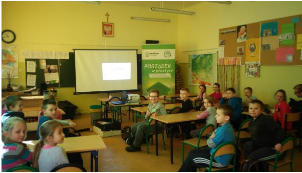
2016-02-09 Szkoła w Starym Gronowie