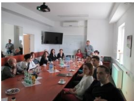
Fot.1 Zdjęcie wykonane podczas spotkania roboczego

24 kwietnia 2015 r. o godzinie 10.00 w Zakładzie Zagospodarowania Odpadów Nowy Dwór Sp. z o.o. odbyło się spotkanie robocze dedykowane pracownikom urzędów gmin. Do siedziby Spółki zaprosiliśmy przedstawicieli 12 gmin z Regionu Południowo-Zachodniego. Była to okazja, aby zapoznać urzędników z kampanią, opowiedzieć o naszych oczekiwaniach dotyczących współpracy z gminami, omówić nasze zalecenia dotyczące gospodarki odpadami na terenie regionu. Zapoznaliśmy przedstawicieli gmin z naszymi obawami, co trudności stworzenia jednolitych materiałów edukacyjnych. Przedstawiliśmy również wyniki ankiety określającej poziom świadomości ekologicznej respondentów oraz ich odczucia związane z zanieczyszczeniem lokalnego środowiska. Dodatkowo zaproponowaliśmy naszym gościom zwiedzanie zakładu i poczęstunek. Spotkanie miało formę roboczą i z pewnością pomogło w nawiązaniu owocnej współpracy w realizacji założeń kampanii.