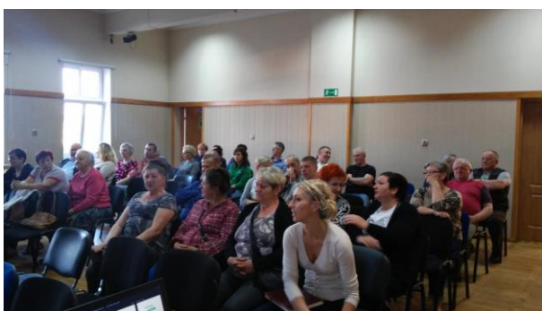
Fot. 31 Zdjęcie wykonane podczas wydarzenia w Rzeczenicy. Liczba osób na zdjęciu: 32

30 marca 2016r. w Urzędzie Gminy w Człuchowie odbyło się spotkanie dla radnych i sołtysów Gminy Człuchów, podczas którego zaprezentowano program kampanii „Porządek w praktyce”