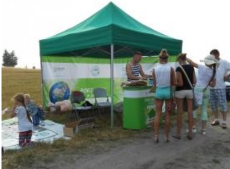
Fot.10 Zdjęcie wykonane podczas wydarzenia w Łęgu

8 sierpnia 2015 r. w Łęgu odbyły się Łęskie Kapuśniaki. Święto Kapusty było wydarzeniem, na którym można było spotkać zarówno mieszkańców gminy, jak i turystów. Dzięki gościnności Gminy Czersk pracownicy Zakładu Zagospodarowania Odpadów Nowy Dwór mogli z powodzeniem przeprowadzić zabawy edukacyjne dla najmłodszych uczestników imprezy, natomiast starszym rozdać ulotki i inne materiały promocyjne. Łęskie Kapuśniaki obfitowały w wiele atrakcji, a dzięki pomysłowości Pani Dyrektora Ośrodka Kultury w Łęgu również nie brakowało elementów z dziedziny gospodarki odpadami. Podczas Święta zaprezentowano, bowiem Monstera wykonanego z surowców wtórnych.