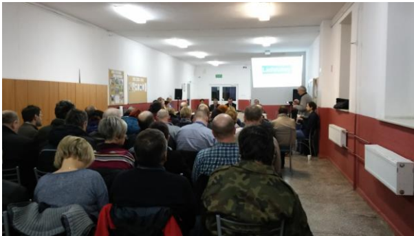
Fot. 22 Zdjęcie wykonane podczas wydarzenia w Lichnowach. Liczba osób na zdjęciu: 41

9 lutego 2016r. podczas spotkanie mieszkańców miejscowości Lichnowy zaprezentowano kampanię „Porządek w praktyce”.