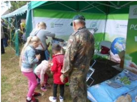
Fot.11 Zdjęcie wykonane podczas wydarzenia w Pieniężnicy

5 września 2015r. odbyły się Dożynki Gminne w Pieniężnicy. Mieszkańcy Gminy Rzeczenica, pomimo deszczowej pogody, tłumnie przybyli na coroczne święto rolników. Sołectwo Pieniężnica przygotowało wspaniałą imprezę, pełną atrakcji dla młodszych i starszych. Nasza propozycja edukacyjna kampanii „Porządek w praktyce” spotkała się ze sporym zainteresowaniem.