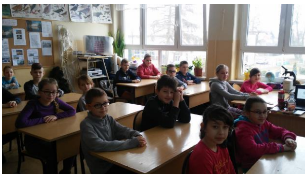
2016-03-16, 2016-03-17 Zespół Szkół Publicznych w Konarzynie