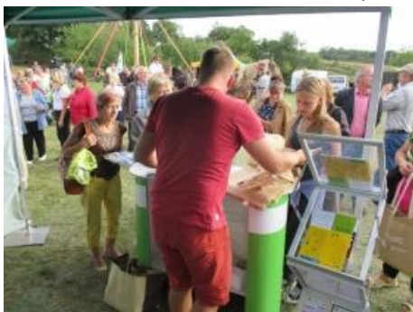
Fot.13 Zdjęcie wykonane podczas wydarzenia w Koczale

19 września 2015 r. namiot kampanii „Porządek w praktyce” gościł w Koczale. Organizowane przez Gminę Koczale dożynki powiatowe były tłumnie odwiedzane zarówno przez mieszkańców gminy, jak i przez gości, i turystów. Nasza propozycja informacyjna po raz kolejny spotkała się ze sporym zaciekawieniem uczestników dożynek.