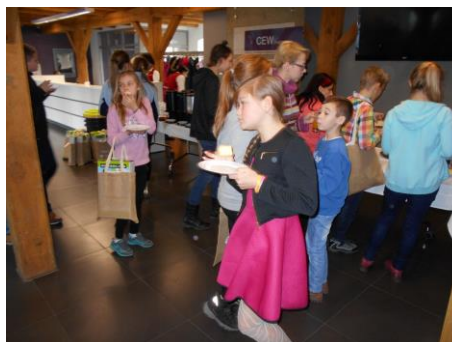
Fot. 18 Zdjęcia wykonane podczas finału konkursu „Segregujemy!”

Do sprawozdania załączona jest następująca dokumentacja konkursu „Segregujemy!”