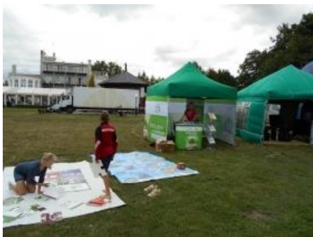
Fot.8 Zdjęcie wykonane podczas wydarzenia w Charzykowach

11 lipca br. w Charzykowach odbył się Filipiak Footvolley Polish Open 2015, czyli Międzynarodowy Turniej Siatkownicy Piłkowej. Dzięki gościnności Gminy Chojnice mogliśmy tam zaprezentować stoisko kampanii „Porządek w Praktyce”. Pomimo deszczowej pogody wiele osób odwiedziło nasz namiot.