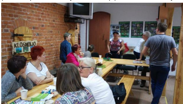
Fot.34 Zdjęcie wykonane podczas wydarzenia w Klosnowie. Liczba osób na zdjęciu: 11

15 czerwca 2016 r. odbyło się spotkanie dedykowane mieszkańcom Miasta Chojnice. Było to wyjątkowe spotkanie ponieważ odbyło się w Wyłuszcarni Nasion w Klosnowie podczas spotkania Chojnickiego oddziału Ligii Ochrony Przyrody. Z racji obecności wielu miłośników przyrody i jednocześnie nauczycieli, mamy pewność, iż informacje dotyczące poprawnej segregacji będą przekazywane dalej, chociażby podczas edukacji szkolnej dzieci i młodzieży.